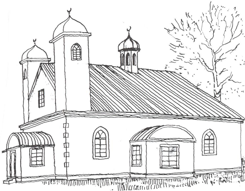
Mešita v obci Kruszyniany