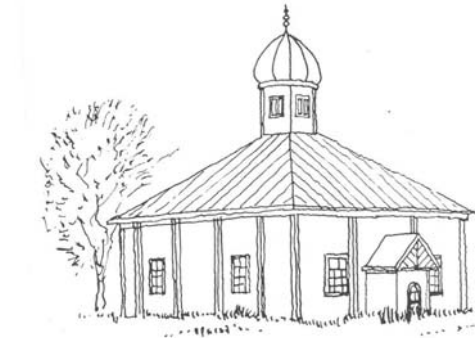
Mešita v Bohonikach

Polsko je dnes tvořeno z 95% katolíky, zbylých 5% připadá na jiná náboženství. Podobně vypadá i národnostní poměr. I mezi Poláky je však poměrně málo známá komunita polských muslimů, kteří se sice dnes identifikují s polskou národností, ale mají tatarský původ. Většina z nich se navíc dále hlásí k islámu. Přestože dnes je tato nepatrná komunita roztroušená po celé zemi, centrem jejich tradičního rozmístění bylo východní Polsko, které proslulo pestrou směsicí náboženských směrů. Kromě polských Tatarů se na tomto teritoriu vyznává pravoslavní, judaismus a funguje zde i centrum víry baha'i .