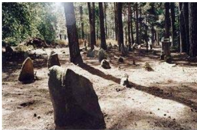
tatarský hřbitov v Bohonikach

Kruszyniany. Vesnice asi 30 km na jih od města Sokółka. Hlavní zajímavostí je mešita , založená v 18. století, jediná mešita na světě, jejíž architektura vychází z slohu katolických kostelů. Dřevěná stavba se dvěma věžemi, které kryjí cibulovité kopule zakončené půlměsícem. Vnitřní uspořádání odpovídá klasické mešitě s malým dřevěným minbarem (kazatelnou) a mihrábem (výklenek, který ukazuje směrem k Mekce) – rozdělení na mužskou a ženskou část. Okolo mešity je muslimský hřbitov ( mizar , mazar ). Ve vesnici žije poslední tatarská rodina.