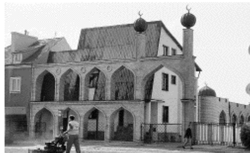
medresa v Bialystoku

Zastřešující organizací je od roku 1925 Muzulmański Zwiazek Religijny , který nepřerušil svou činnost ani v průběhu 40letého období