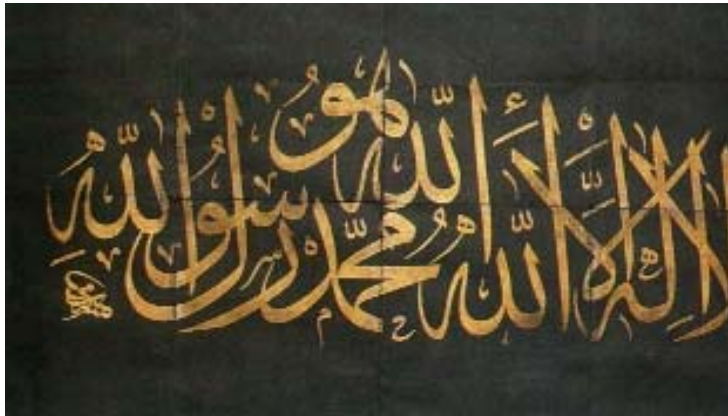
muhir – nápis v mešitě

„lá iláha illá ,lláh wa Muhammadanrasúlu ,lláh“ (Není boha kromě Boha a Muhammad je Posel Boží)