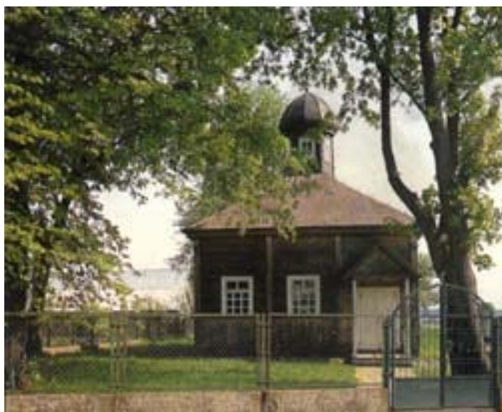
Mešita v Bohonikách